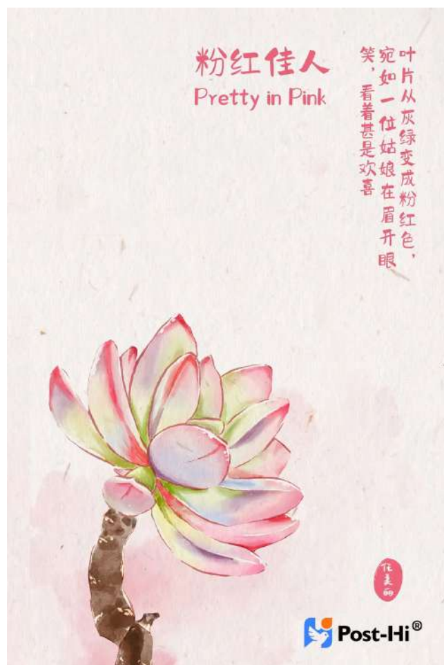
在明信片图像面中使用

以下提供了一些 Post-Hi 图标的使用示例，您仍然可以根据自己的实际情况做出调整。