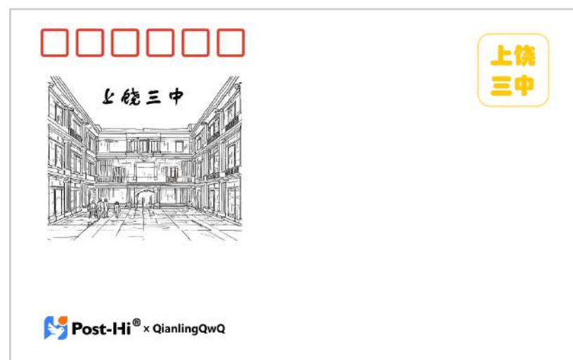
在明信片文字面中与 Post-Hi 联名